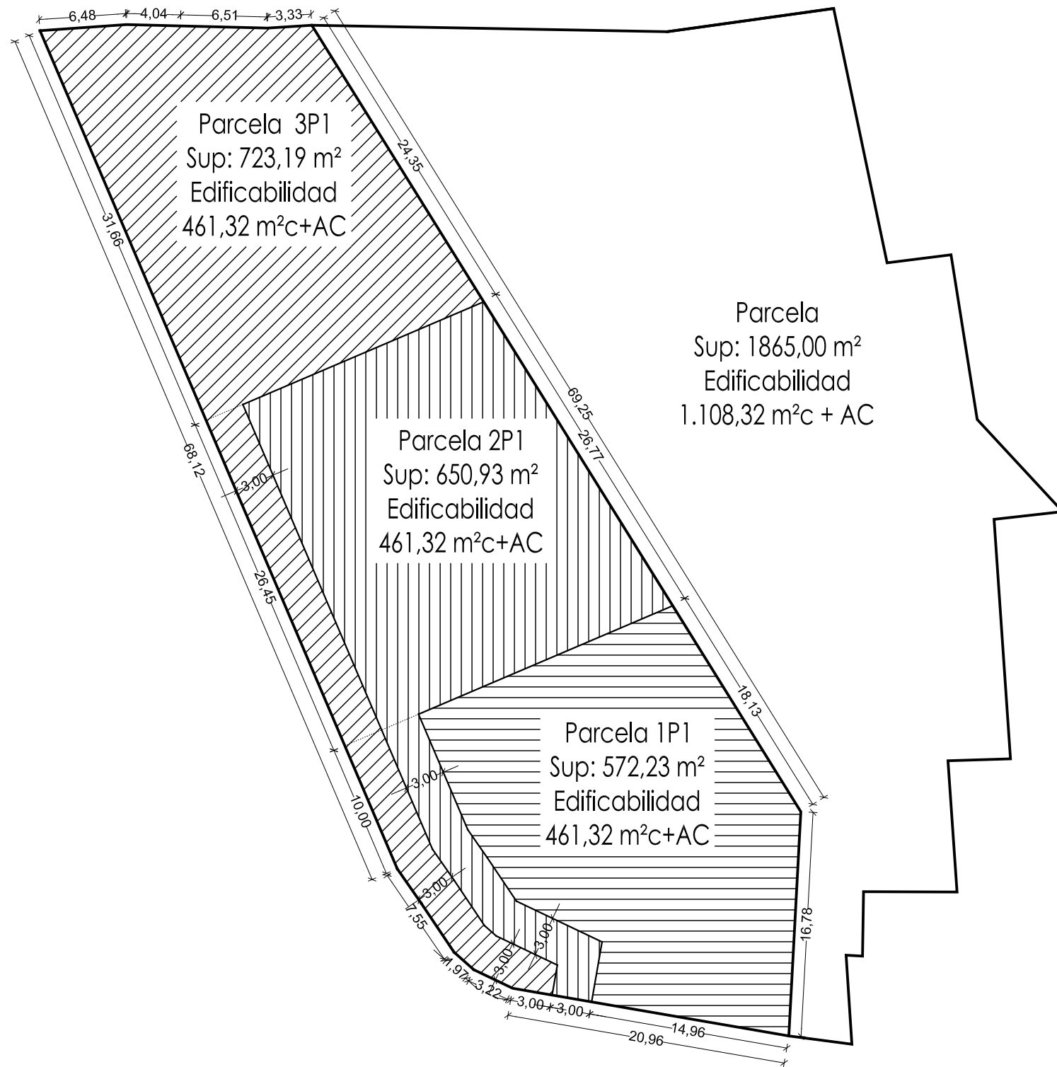
PARCELA 1 PLANTA PARCELACION